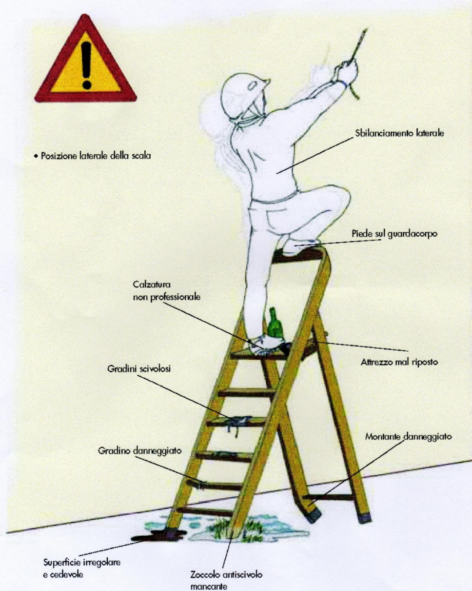
Fig. 11b - Uso errato